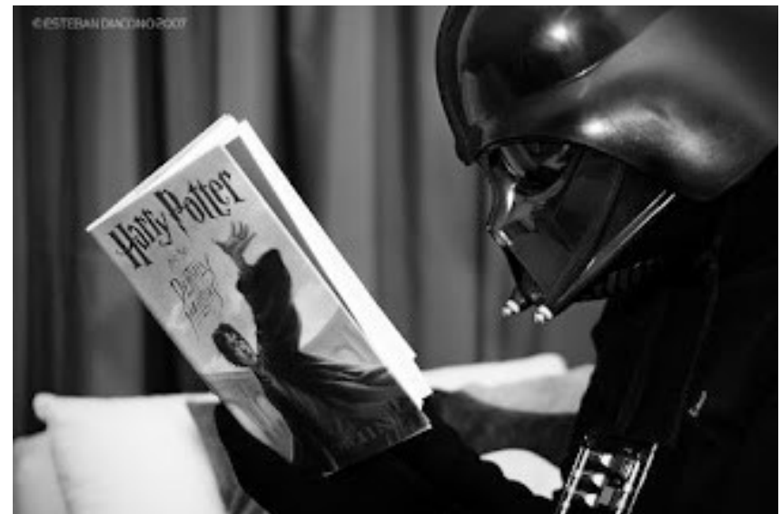
Harry Potter – Star Wars J.K.Rowling 2001 - George Lucas 1977